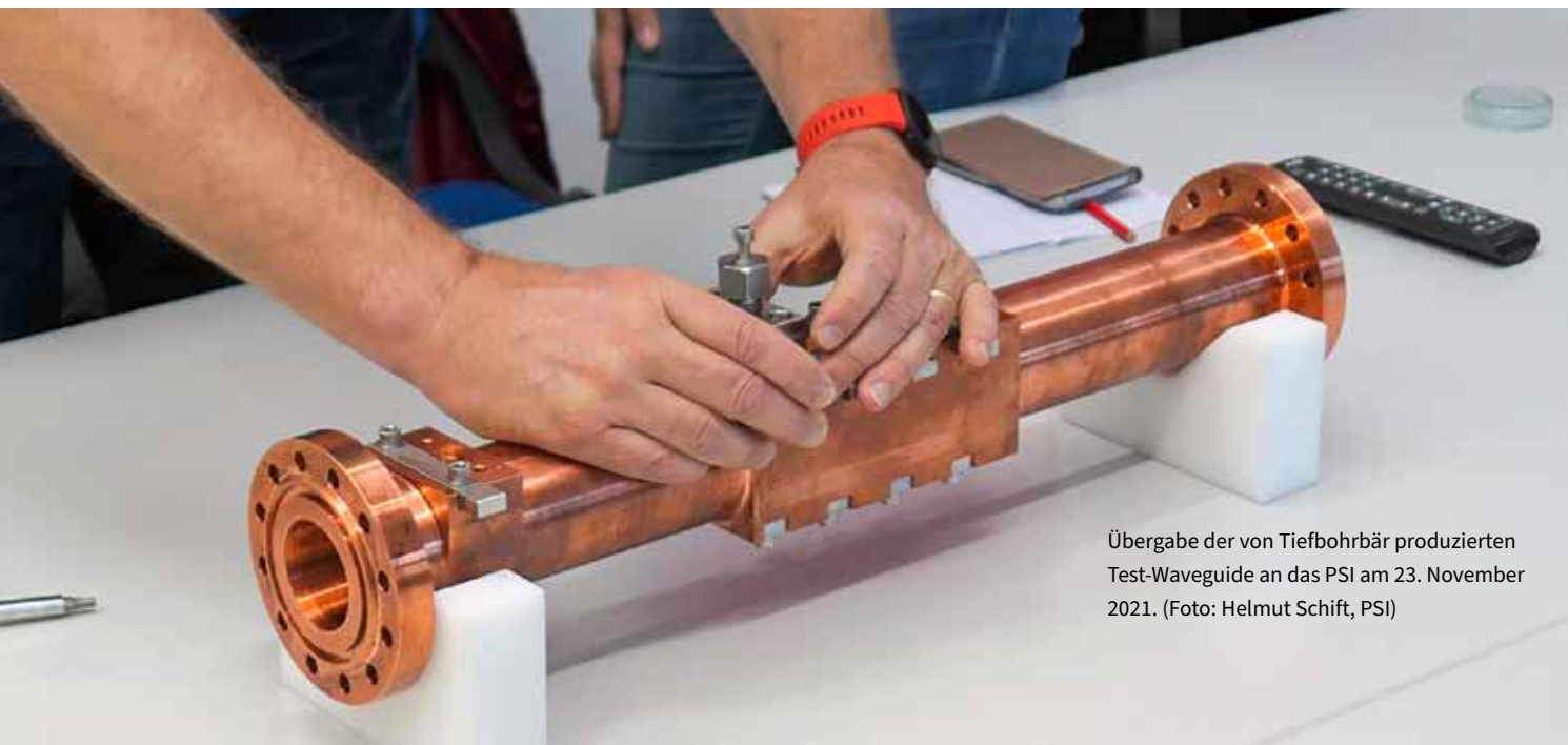
Übergabe der von Tiefbohrbär produzierten Test-Waveguide an das PSI am 23. November 2021.

haben wir bereits verschiedene Mockups hergestellt und damit den Nachweis erbracht, dass Tiefbohrbär solch hochpräzise Bauteile herstellen kann. Die Waveguides sind mit einer extrem feinen Rillierung in der Präzisionsbohrung veredelt (= Korrugation). Da diese Komponenten im Ultrahochvakuum-Bereich (UHV) eingesetzt werden, ist eine extreme Bauteilsauberkeit notwendig. Und genau hier liegt eine grosse Herausforderung: Denn es ist mit bisher bekannten Reinigungsmethoden nicht möglich, die feine Korrugation ausreichend zu reinigen. Wir haben das Hightech Zentrum Aargau kontaktiert und die Aufgabenstellung geschildert.